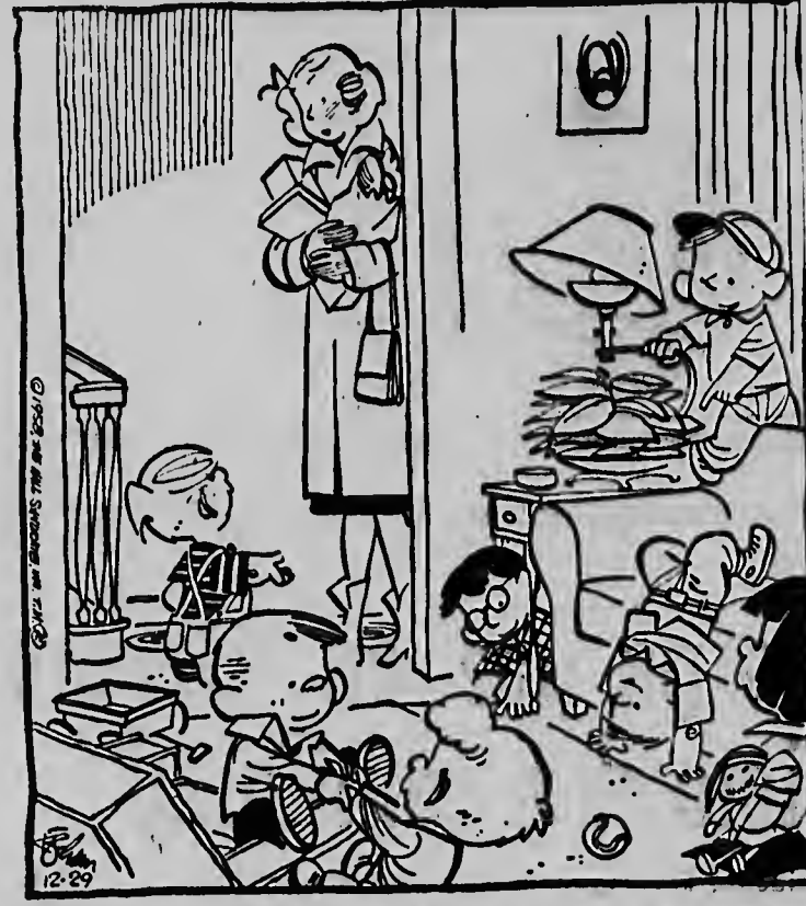
„Ze hebben beslist dat jij de „moeder van het jaar“ bent!“